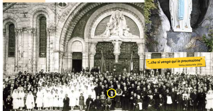
1934: foto storica del primo pellegrinaggio diocesano a Lourdes organizzato dalla Sezione Veneta dell'Unitalsi con San Leopoldo Mandić (in basso nel cerchio)