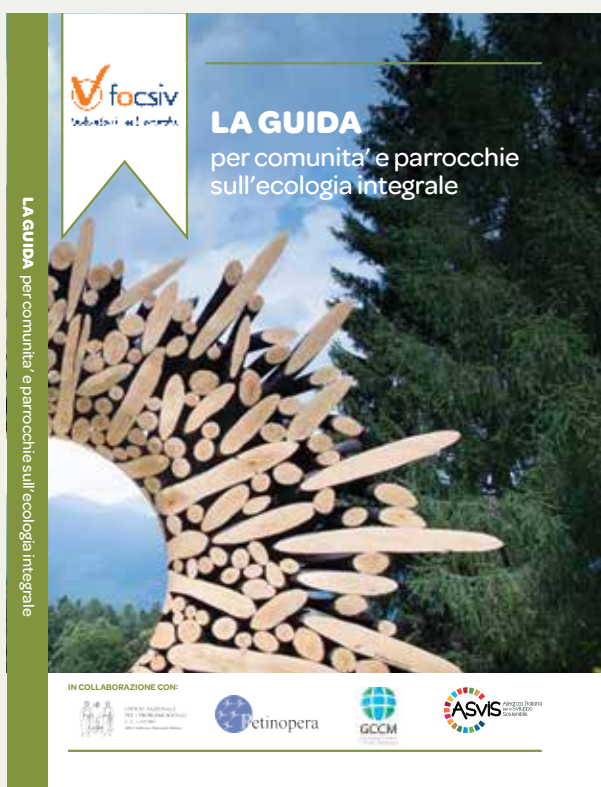
La Guida per comunità e parrocchie sull'Ecologia Integrale 2020 – FOCSIV